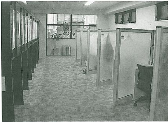
区切られた空間で落ち着いて勉強ができる「アットスペース」の店内

◆ 10月に大須大道祭りを盛り上げ、「異種格闘技大」あふれる催しをの模擬店や皿回